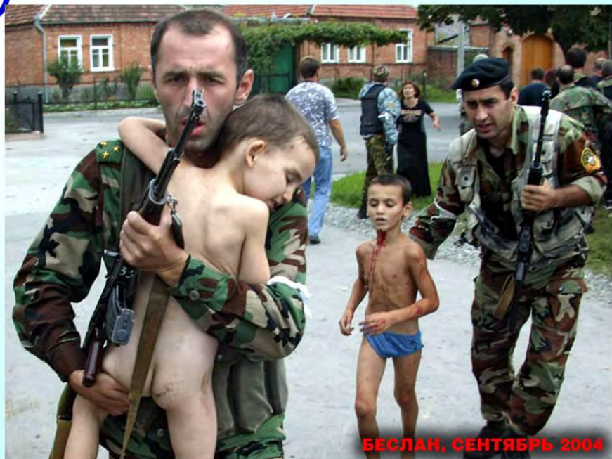
БЕСЛАН, СЕНТЯБРЬ 2004